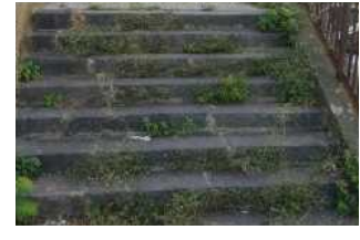
Scalinata S. Luigi: serve una scerbatura

"Se proprio dovessi indicare un genere, parlerei di thriller sociale, nel presupposto - perché no - che ogni crimine sia perpetrato in nome collettivo e non sia che il risultato di colpe sociali, comuni" aggiunge Bonina.