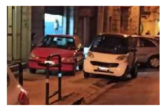
Doppia sosta selvaggia sul marciapiede. Bloccato anche l'ingresso di un palazzo