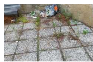
Villetta Castronovo, sporcizia e spazzatura nel verde