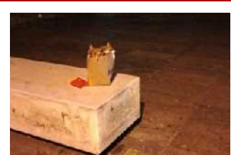
Piazza Cairoli: va bene l'asporto, ma perché questa inciviltà?