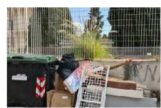
Parcheggio via Del Santo, passate le festività dei defunti torna la discarica