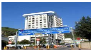
Salerno: concorso pubblico per titoli ed esami per... 23 Marzo 2020