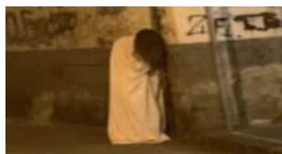
Samara vista nei pressi del Parco del Mercatello, ... 2 Settembre 2019