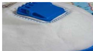
Impresa Sicura: al via i rimborsi per le imprese c... 30 Aprile 2020